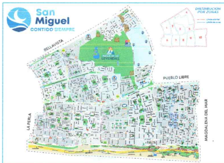
Figura N°02: Mapa del Distrito