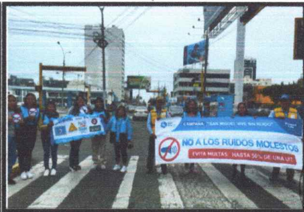
Imagen N°01 y N°02: Campaña San Miguel Vive sin Ruido

Las actividades de supervisión y control de las fuentes fijas y móviles de ruido, son definidos en función a los siguientes criterios: